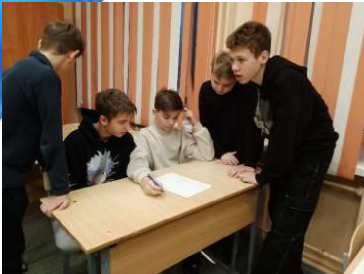
Проведение патриотических квестов