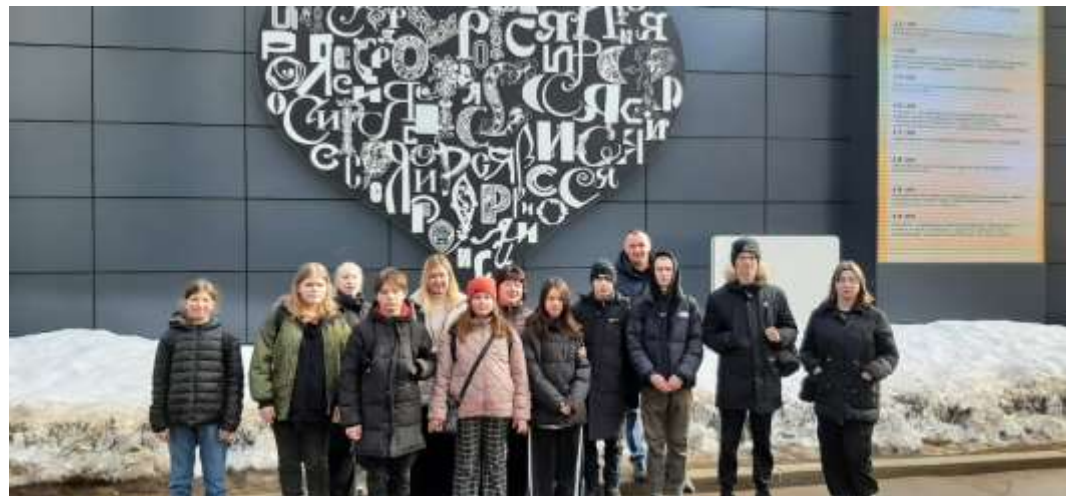
Поездка в Москву на Выставку-Форум «Россия»