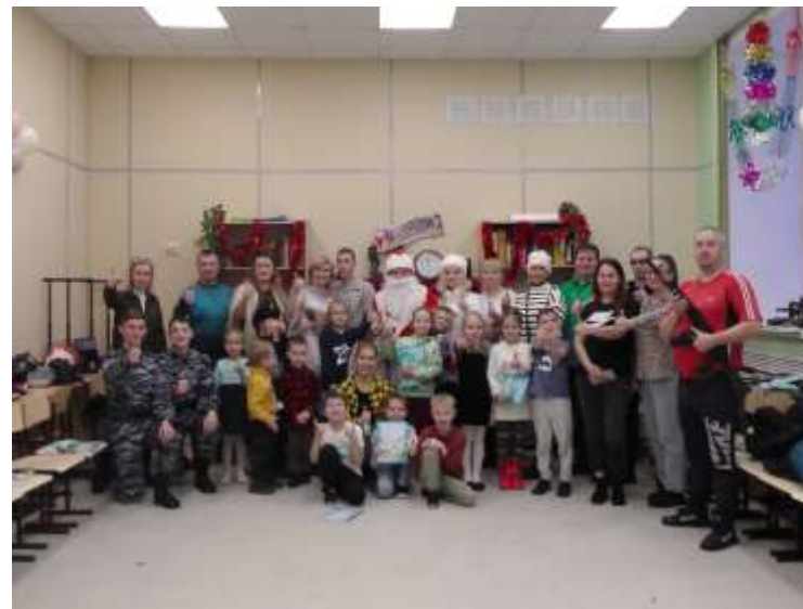
Проведение выходного с родителями