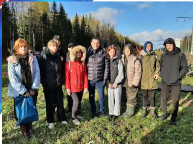
Поездка на Юрьевский рубеж