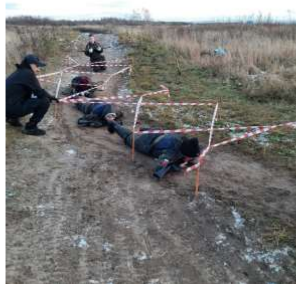
Участие в военно-патриотических играх